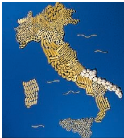
► Diversas formas de pasta.

Los sicilianos subieron hasta Bolonia en batallón, con sus flamantes