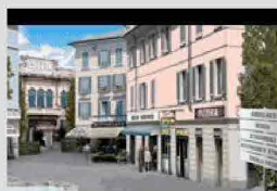
La Piazzetta McCain

Sono stati 90 i partecipanti al 36° Corso di cui 70 quelli che hanno superato la prova d'esame del 10 giugno, per gli altri la seconda sessione è stata programmata per martedì 12 luglio. La