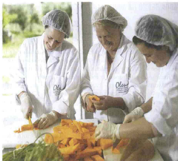
Gruppo di operaie al lavoro in una fabbrica conserviera