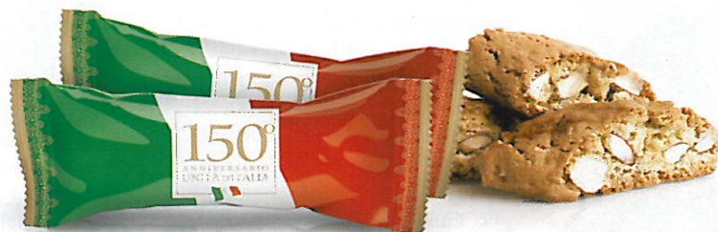
Il cantuccio d'Abruzzo nella versione tricolore

serata celebrativa andata in onda e condotta da Pippo Baudo con il giornalista aquilano Bruno Vespa; dalle compagnie aeree nazionali, oltre alla già citata Blue Panorama, anche Alitalia, Air One, Meridiana e da Lufthansa, con i passeggeri tedeschi conquistati dalla bontà. Questo dolce secco trae origine da un'antica ricetta abruzzese ed è commercializzato in esclusiva, da Falcone Dolciaria, in quasi tutto il mondo. Si differenzia da quello toscano sia per gli ingredienti che per la friabilità. Risulta particolarmente gradevole al palato col caffè espresso, come consiglia il popolare comico abruzzese "N'ducio" nel divertente spot in onda sulle principali emittenti televisive regionali.