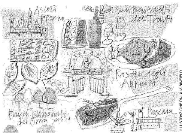
ILLUSTRAZIONE DI JULIA BINFIELD

Lungomare Trento 37 Roseto degli Abruzzi Teramo Tel. 085-8931170